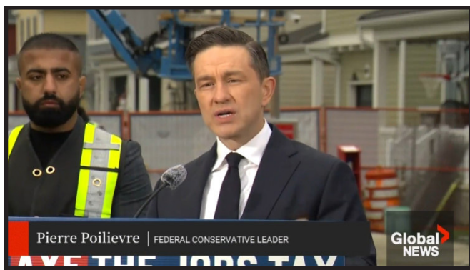
Pierre Poilievre | FEDERAL CONSERVATIVE LEADER

他说：“显然，必须为一切做好准备，因为特朗普政府的信号可能随时变化。”他补充说，保守党政府不会效仿特朗普退出世界卫生组织 (WHO)。他还抨击了自由党党魁竞选者方慧兰 (Chrystia Freeland) 和马克·卡尼 (Mark Carney)，称他们无法对抗特朗普。他表示，方慧兰在担任外交部长期间与特朗普政府谈判时“非常非常软弱”，而卡尼则“更软弱”。方慧兰在周日的党魁竞选启动仪式上指责博励治“软弱”，声称他准备向美国屈服，出卖加拿大。她说：“他永远无法对抗特朗普。他甚至无法对抗阿尔伯特省省长史密斯。”史密斯认为对特朗普的关税威胁采取石油出口税或其他报复措施并非正确。博励治周二发表声明称，加拿大需要对美国采取报复性关税，并呼吁总理结束议会休会，做好应对准备。